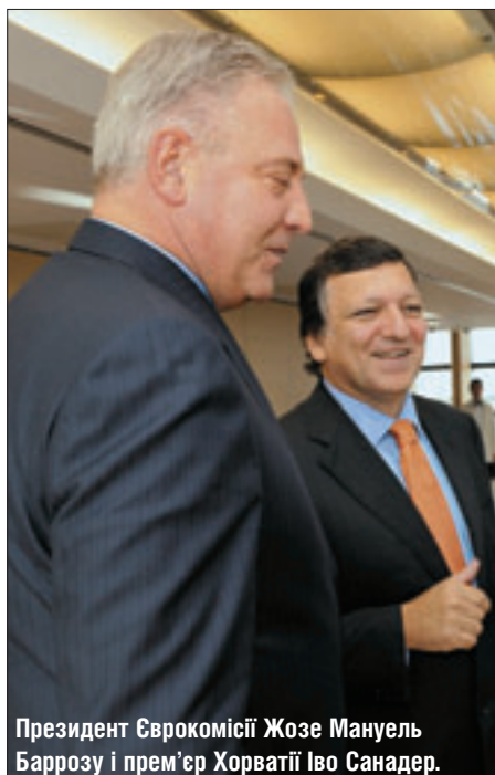
Президент Єврокомісії Жозе Мануель Баррозу і прем'єр Хорватії Іво Санадер.

— У цих планах має бути місце і для Баклан, — додав пан Вондра. Чеський та сербський віце-прем'єри також обговорили шляхи надання економічної допомоги Сербії, так само як і іншим європейським країнам, для боротьби з наслідками фінансової кризи. □