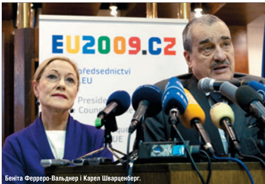
Беніта Феррєро-Вальднер і Карел Шварценберг.