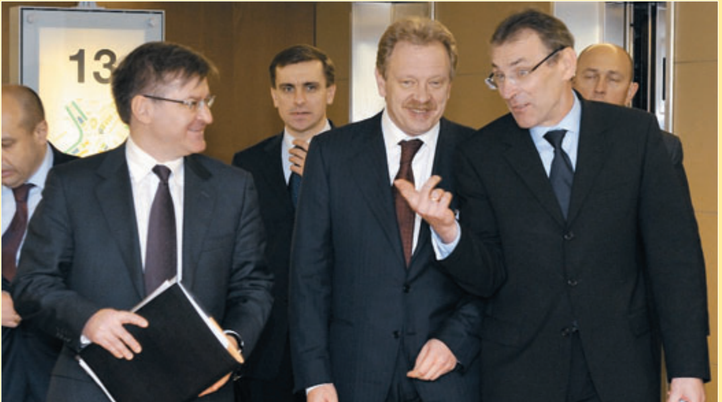
У січні Брюссель був одним із центрів переговорів з вирішення газового конфлікту (стор. 4–8). На фото (зліва направо): віце-прем'єр-міністр України Григорій Немиря, керівник НАК «Нафтогаз–Україна» Олег Дубина і Комісар ЄС з енергетичних питань Андріс Пієбалгс.

З нагоди Міжнародного жіночого дня 8 Березня Європейська Комісія оголошує конкурс дитячого малюнка серед дітей віком від 8 до 10 років на тему гендерної рівності. Учасникам пропонується зобразити на аркуші паперу А4 своє бачення рівності між чоловіками та жінками. 10 переможців конкурсу отримають цінні подарунки від Представництва Європейської Комісії в Україні. Головний приз — 1000 євро отримає переможець міжнародного туру від України та його школа. Малюнки необхідно надіслати до 15 травня 2009 року в конверті з позначкою «Конкурс дитячого малюнка» до Представництва Європейської Комісії в Україні за адресою вул. Круглоуніверситетська, 10, м. Київ, 01024. Додаткову інформацію щодо конкурсу можна одержати на веб-сторінці www.delukr.ec.europa.eu або за телефоном в Києві (044) 279-85-75.