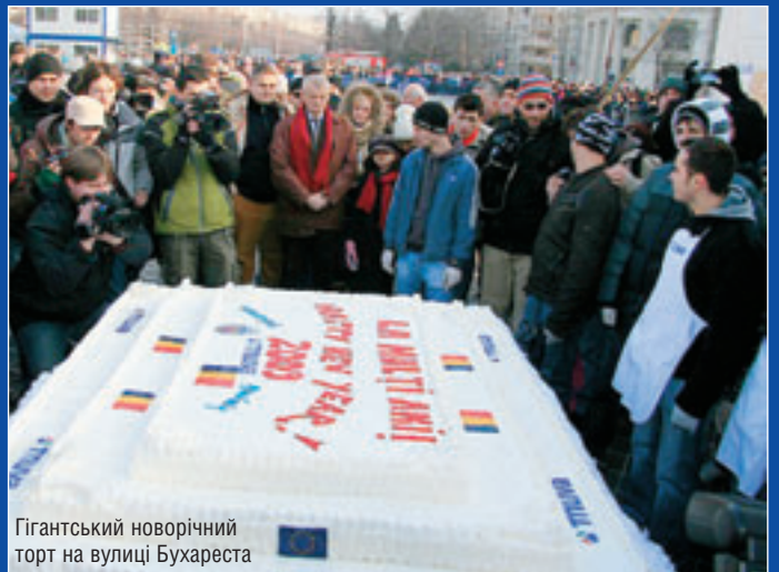
Гігантський новорічний торт на вулиці Бухареста