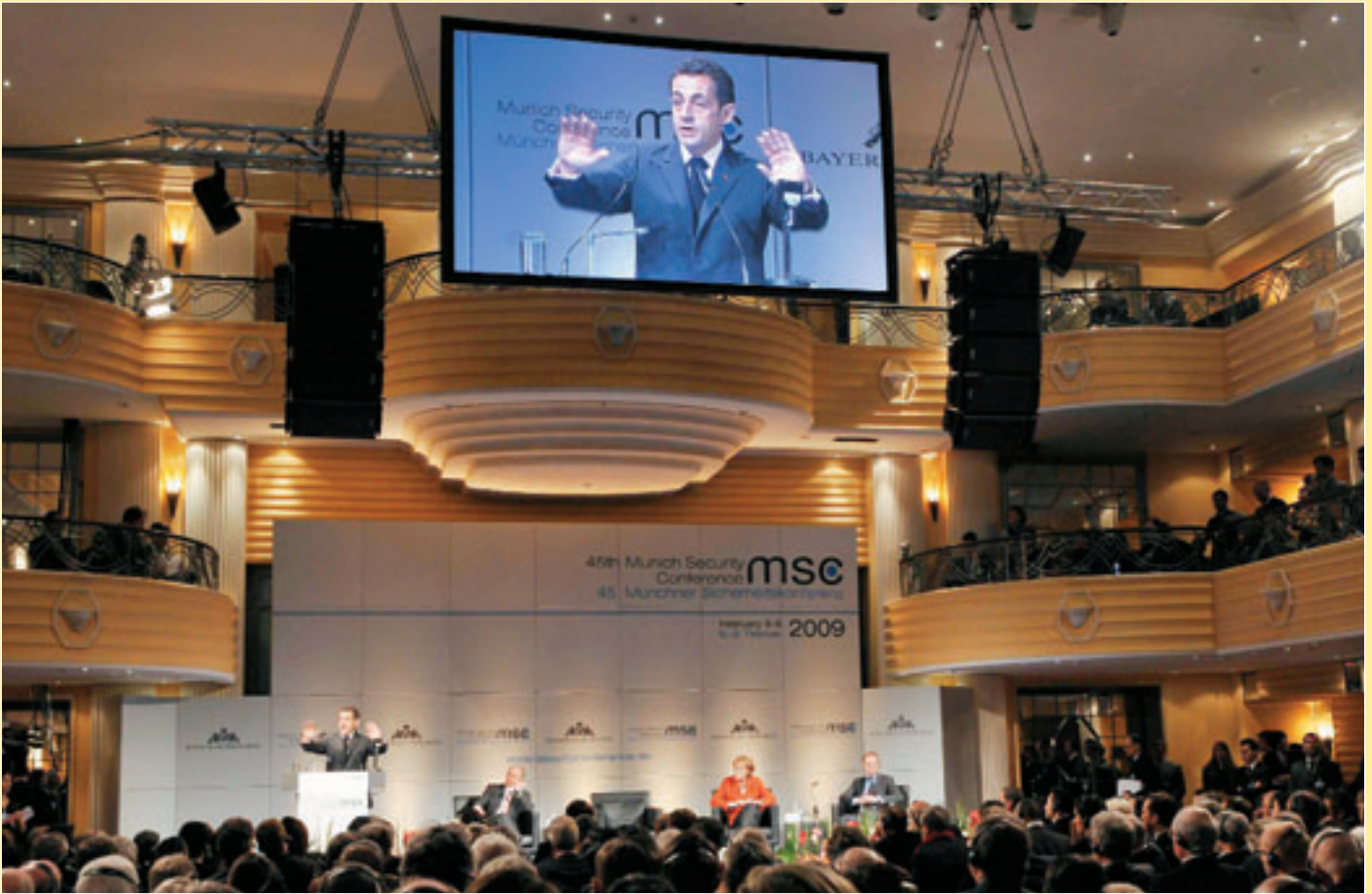
Читайте в наступному номері: • У Мюнхені відбулася міжнародна конференція з питань безпеки. Участь у ній взяв і Президент Єврокомісії Жозе Мануель Баррозу. • У Брюсселі пройшов Тиждень альтернативної енергетики. На фото: Комісар ЄС з питань довкілля Ставрос Дімас.