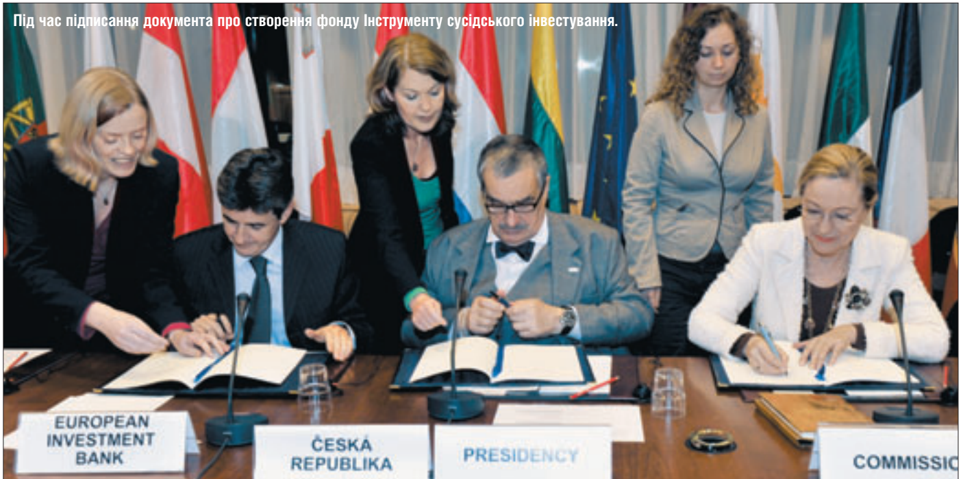
Під час підписання документа про створення фонду Інструменту сусідського інвестування.

ЗАСВІДЧИВ СВОЮ ЕФЕКТИВНІСТЬ У Єврокомісії підвели підсумок року діяльності Інструменту сусідського інвестування. Результати вагомі. 2008-го ЄС витрачено в рамках ICI 71 млн євро на підтримку інфраструктурних проєктів, що реалізувалися в країнах-партнерах у рамках Європейської політики сусідства.